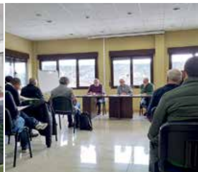
Preparatoria de la Zona Norte