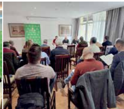
Preparatoria de la Zona Tajo-Guadiana