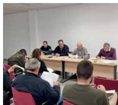
Preparatoria de la Zona Tafalla