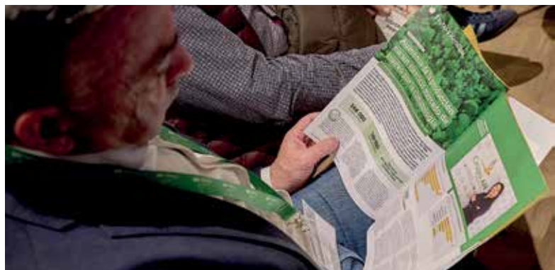
El público recibió la memoria y el número especial de Acción Cooperativa que resume el ejercicio

El tercer punto del orden del día contemplaba el examen y la aprobación del Estado de información no financiera consolidado correspondiente al ejercicio 2023/24. Como recordó Arbeloa, se trata de un informe que se requiere a las empresas que cuentan con más