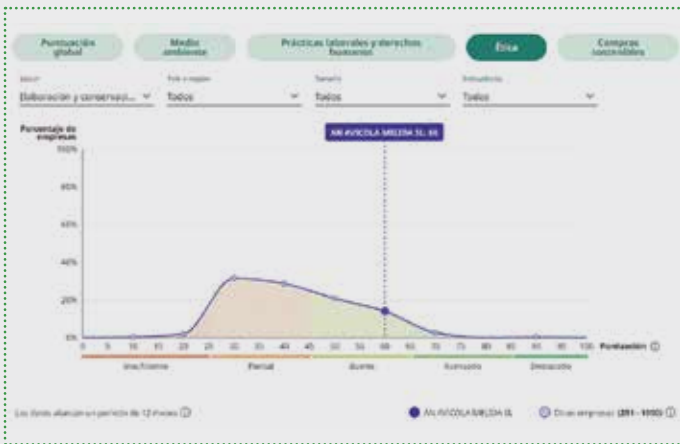
Distribución de la puntuación de la dimensión Ética de las empresas del sector

Esta herramienta marca un camino que, a través de la mejora en la gestión, logrará resultados y, además, permitirá un reporte de calidad en sostenibilidad. Se trata de un avance relevante, ya que AN Avícola se ha comprometido a alcanzar los objetivos de sostenibilidad que marca la sociedad y el momento actual exige, no solo hacerlo bien, sino también reportar de manera excelente.