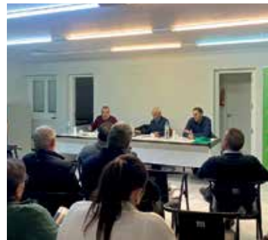
Preparatoria de la Zona Extremadura