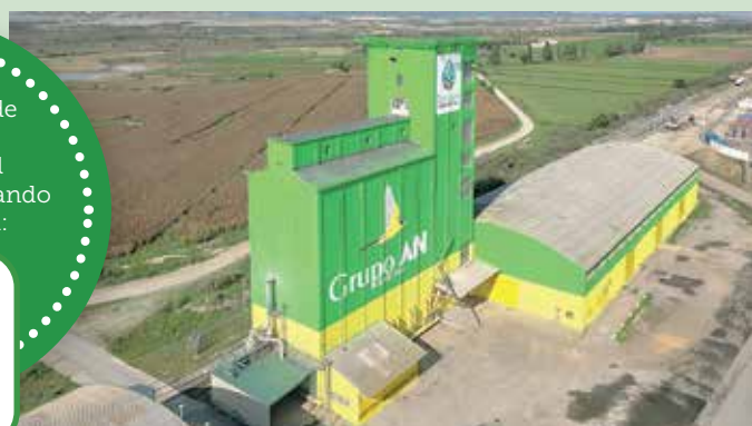
Diferentes imágenes que aparecen en el vídeo que resume el ejercicio 2023/24