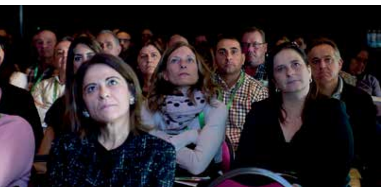
Asistentes durante el momento en el que se proyectó el vídeo que resume el ejercicio

de 500 personas en su plantilla y que refleja cuestiones medioambientales, sociales, relativas al personal y en relación con los derechos humanos, entre otras. Se mostró a la asamblea la verificación de ese informe, auditado también de forma externa.