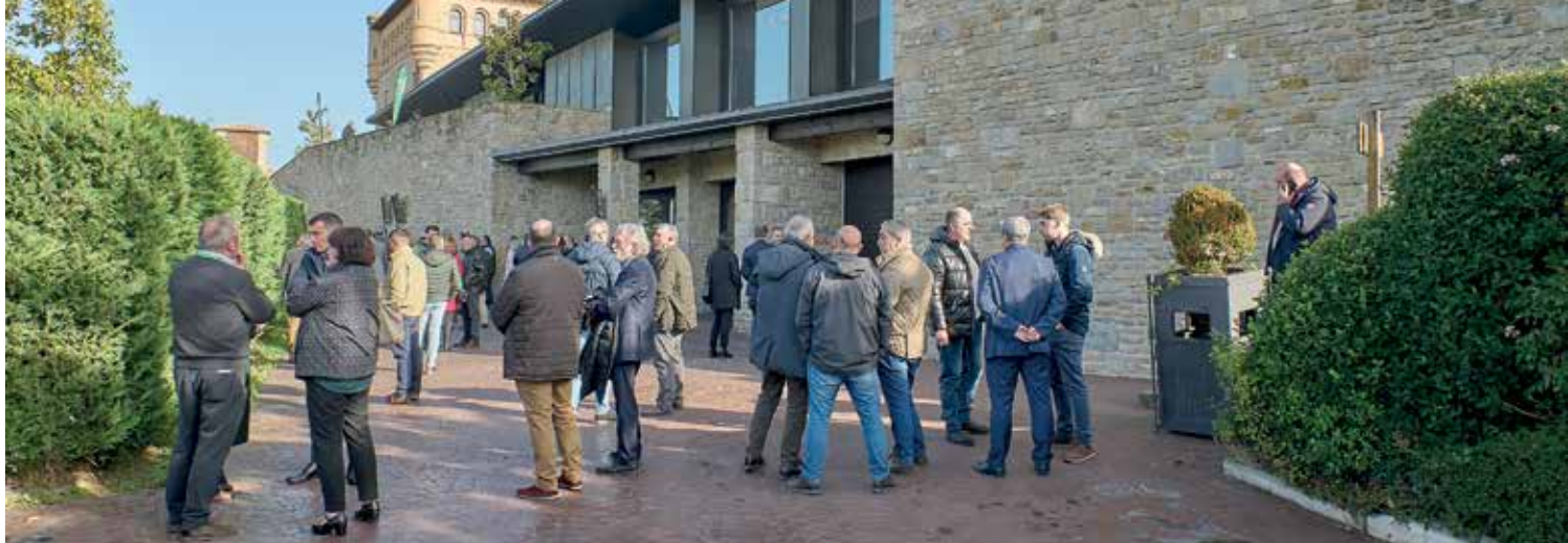
Asistentes a la Asamblea General, en los minutos previos a su comienzo

La Asamblea General del Grupo AN congrega cada año a más de trescientas personas en el salón El Trovador del hotel Castillo de Gorraiz. La cifra se ha repetido también en este 2024, entre miembros de las cooperativas socias, profesionales de distintas áreas del Grupo AN y personas invitadas como representantes de instituciones, empresas y otras entidades relacionadas con la actividad del Grupo AN.