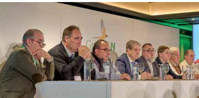
Parte del Consejo Rector del Grupo AN durante la asamblea