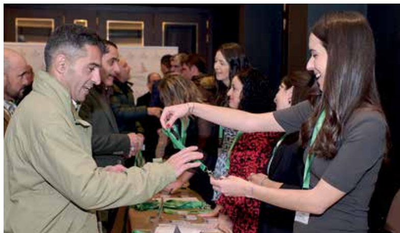
Antes de acceder al salón, las personas invitadas recogieron sus acreditaciones