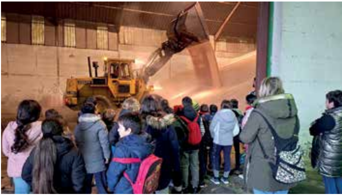
Alumnos del colegio de Mendigorriá observan cómo descargan el cereal en las instalaciones