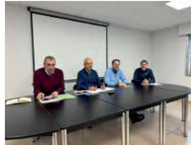
Preparatoria de la Zona Alto Ebro