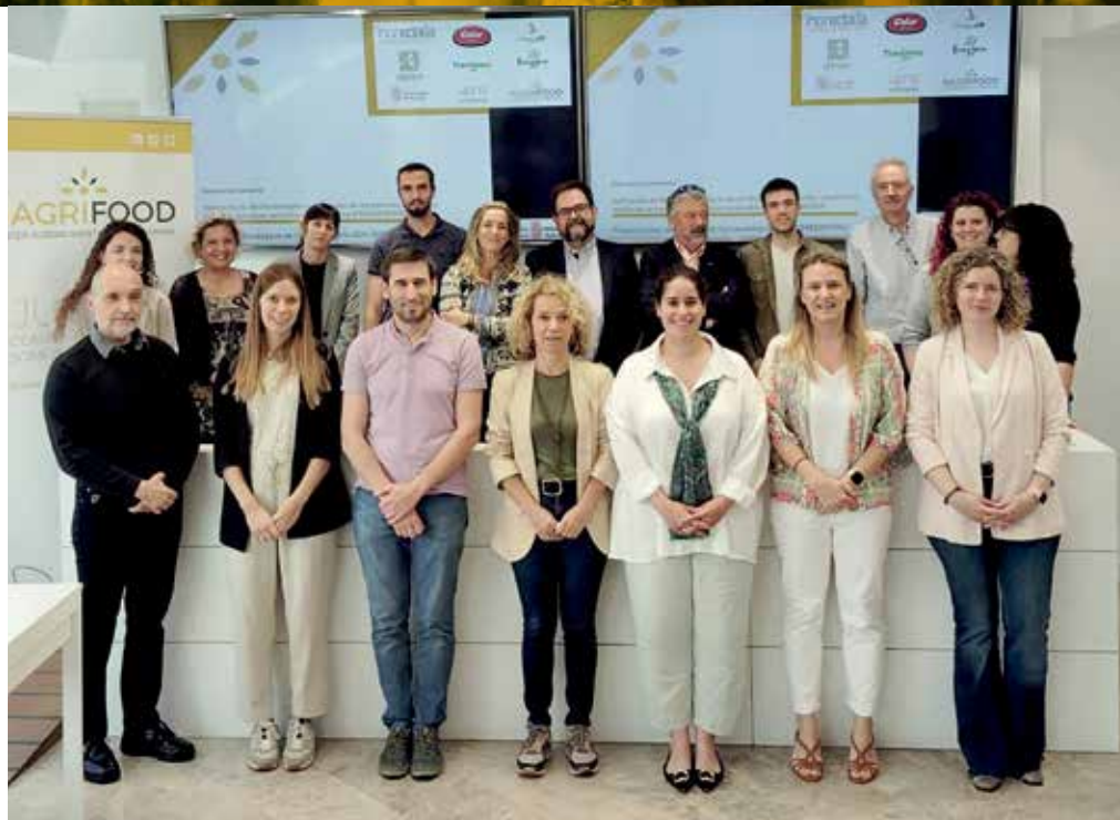
La primera reunión del proyecto Biogreenfood tuvo lugar el pasado mes de julio en la sede de Nagrifood

A partir de ese momento, el nuevo proyecto estratégico ha comenzado a estudiar la aplicabilidad de estas nuevas fuentes de proteína vegetal en la industria alimentaria y su aceptación desde el punto de vista del sabor y de los beneficios para la salud.