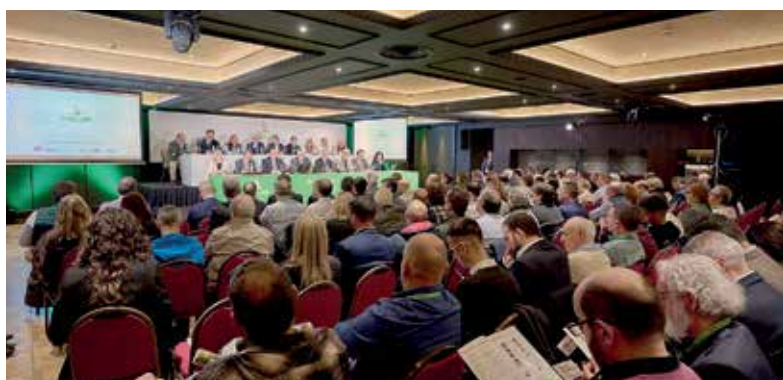
Más de trescientas personas siguieron la Asamblea General desde el salón El Trovador de Gorraiz