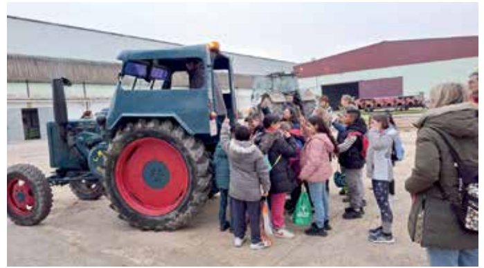
Los escolares disfrutaron descubriendo cómo eran los tractores hace 100 años

Por otro parte, desde la Fundación Grupo AN les enseñaron las novedades de la última extensión del videojuego agrario Farming Simulator. Este módulo de agricultura de precisión es fruto de un proyecto de EIT Food en el que colabora el Grupo AN y que persigue difundir la importancia de lograr una agricultura sostenible a través de las ventajas que aporta la agricultura de precisión.