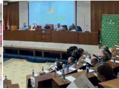
Preparatoria de la Zona Duero