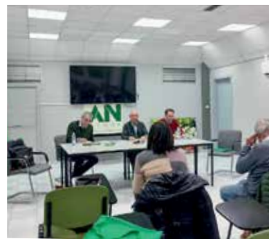
Preparatoria de la Zona Tudela