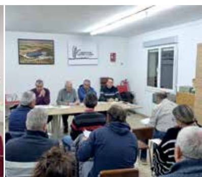
Preparatoria de la Zona Estella