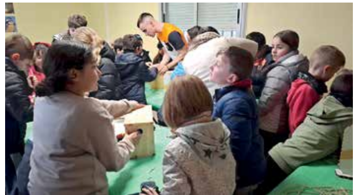
El alumnado se dividió en pequeños grupos para construir las cajas nido

El Gobierno de Navarra ha financiado la realización de esta actividad en el marco de la convocatoria de Ayudas al fomento de la cultura científica, la difusión de la I+D+i realizada en Navarra y al fomento de las vocaciones STEM. Cosmos 2024.