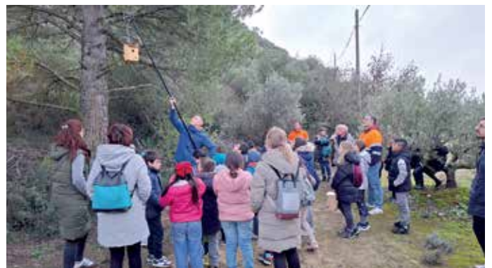
El personal de la Fundación Ilundain ayudó a los estudiantes a colocar las cajas nido