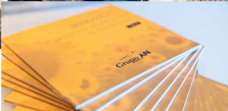
Durante el evento se presentó una nueva edición de InnovAN