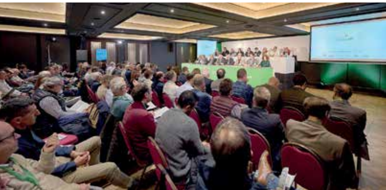
Imagen del público asistente al evento