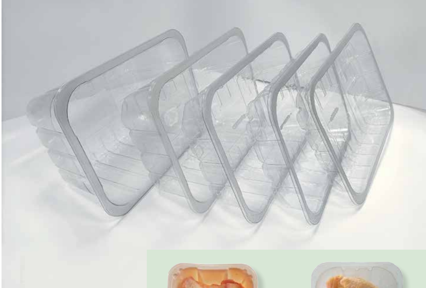
Varias bandejas de material 100 % PET

material y si el plástico que se utiliza en los envases se recicla.