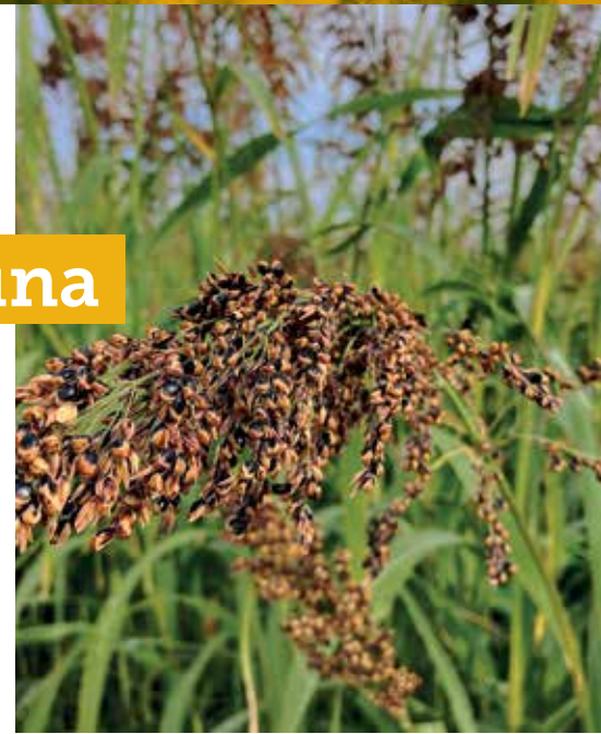
Sorgo en Fustiñana, Navarra, durante la primera fase del proyecto

El proyecto CATCH-BNI propone incorporar cultivos cobertera con capacidad BNI previamente al cultivo principal. Los BNI son compuestos producidos por ciertas especies vegetales que, una vez liberados a través de sus raíces, actúan inhibiendo la oxidación del amonio a nitrato en el suelo. Así, además de los beneficios agronómicos tradicionales de los cultivos cobertera, la permanencia de moléculas BNI en el suelo ralentizarán la nitrificación tras la fertilización del cultivo principal, mejorando la eficiencia en el uso del nitrógeno. De hecho, se considera que la capacidad de producción de BNI es característico de algunas plantas que habitan en entornos deficitarios en nitrógeno. Esta capacidad es típica de plantas como el sorgo, cultivo de primavera que presenta diversos usos potenciales y que da buenos rendimientos. No obstante, no todas las variedades