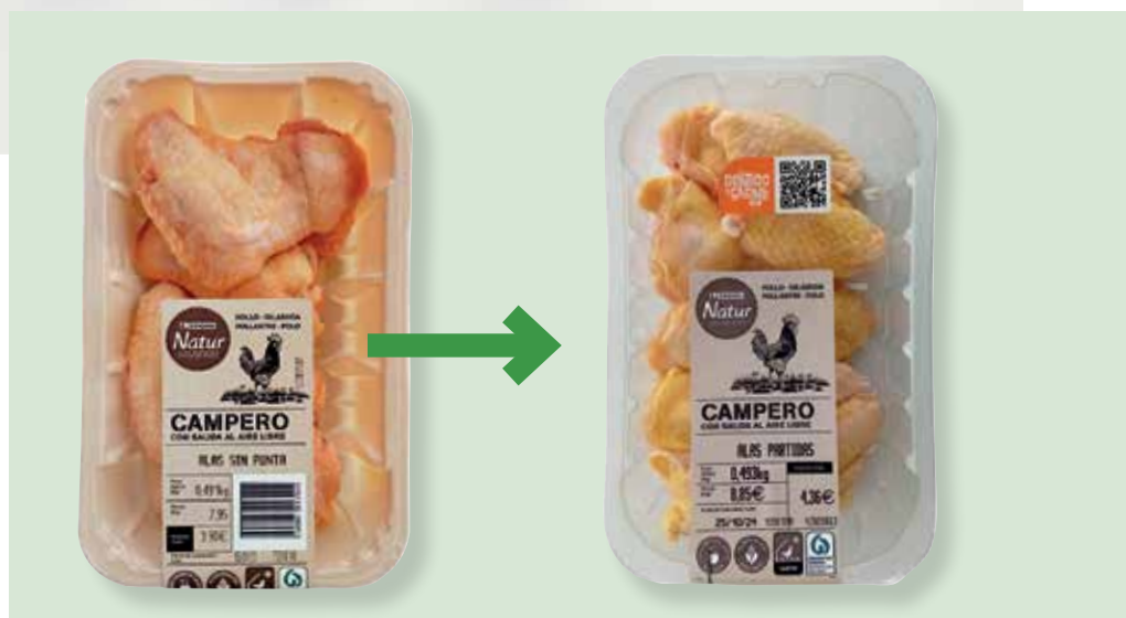
El cambio de los envases se está completando a lo largo de este año. Las imágenes muestran el antes (izquierda) y el después

Además, si al envase transparente se añaden colorantes y/o capas de otros materiales para mejorar la conservación y aspecto, la dificultad es todavía mayor. Por eso es tan necesaria esta transición a envases 100 % PET, porque permiten que todo envase sea reciclable sin limitaciones, asegurando la sostenibilidad del sistema de envasado de productos.