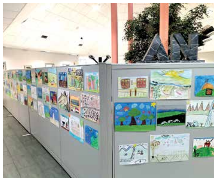
Dibujos de la última edición del concurso decorando la sede central del Grupo AN en Tajonar

El doble concurso premiará tanto a las personas seleccionadas por el jurado, como a sus respectivos colegios