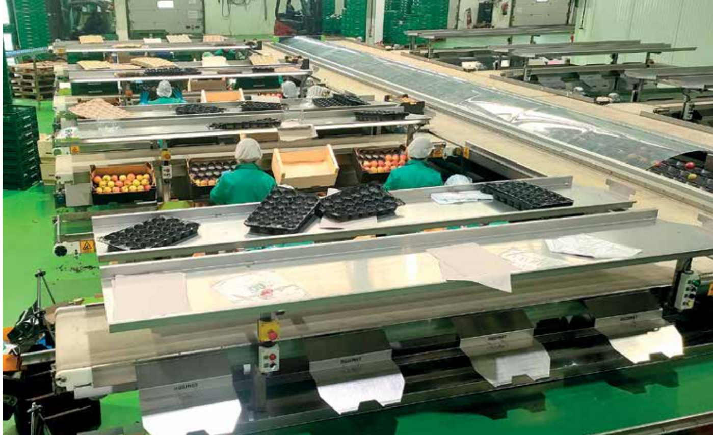
Las imágenes de esta página representan distintas fases del proceso de almacenamiento y conservación de la manzana fuji en el Centro Hortofrutícola de Tudela