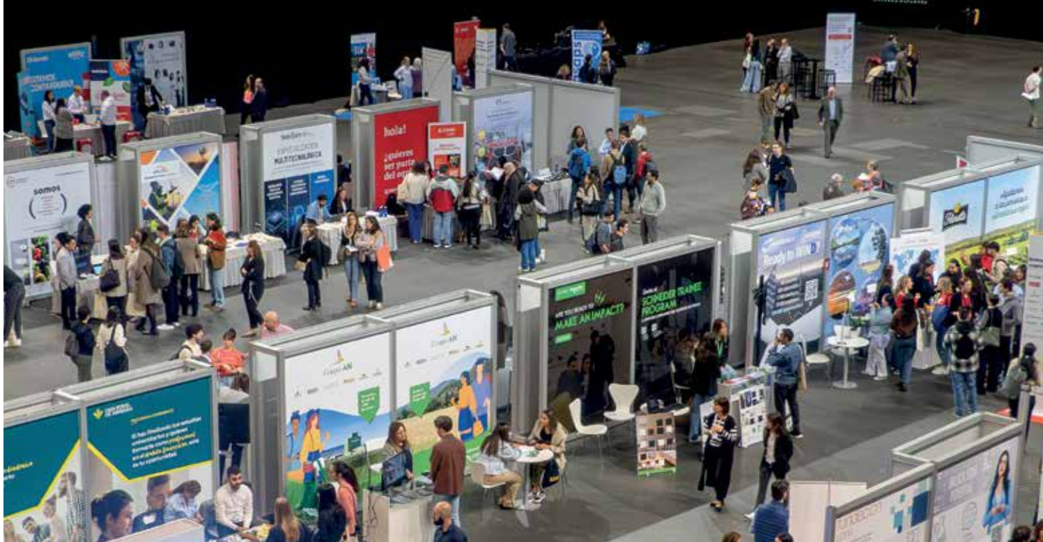
El evento reunió en el pabellón Navarra Arena a 1.200 asistentes con 87 empresas y entidades

la Ley Orgánica de Protección de Datos es imprescindible para formar parte de la base de datos de potenciales aspirantes a un puesto de trabajo. Además, en este apartado se pueden encontrar todas las ofertas activas de empleo del Grupo AN.