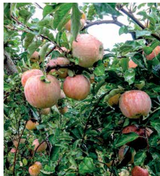
La fuji es la más tardía de las variedades de manzana en ser recolectada en Navarra

Por lo general, el agricultor que tiene frutales realiza un manejo escalonado cultivando diferentes variedades, lo que le permite optimizar la recolección. Además, "constantemente se están investigando