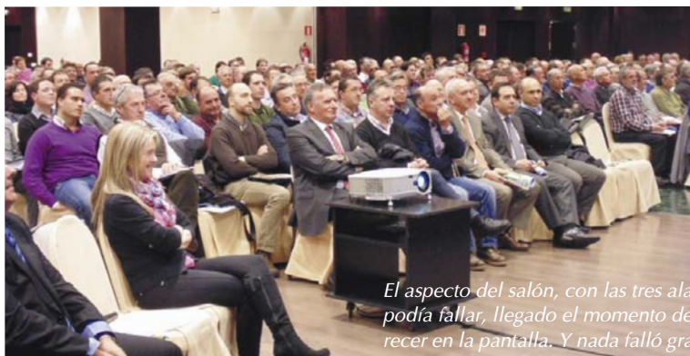
El aspecto del salón, con las tres alas que abrazaban el escenario a rebosar, era espectacular. Nada podía fallar. Llegado el momento de las intervenciones, ese en el que la presentación no suele aparecer en la pantalla. Y nada falló gracias.